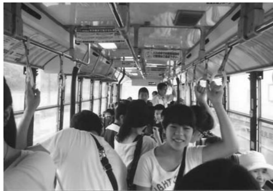
8月26日 上新栄町第一自治会育成部のみなさんがQバス体験乗車しました。

行きは内回り、帰りは外回りで、ちょうど良い時間のバスがあり大勢での乗り降りで時間がかりましたが、バスの運転手さんが優しい方で子ども達が安心して利用することができました。 今年度もQバス体験乗車のおかげで、子ども達の夏休みの良い思い出になったと思います。大変お世話になりました。ありがとうございます。