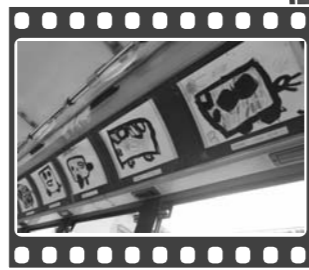
▲ 写真は過去に開催した小針保育園の園児さん達の作品です。