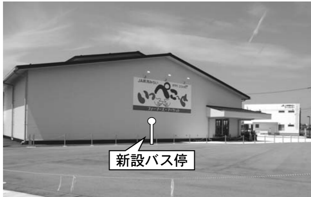
併せて、定時制の確保や更なる利便性向上を目指し運行ダイヤを改正します。

9月5日(土)からQバス(坂井輪コミュニティバス)の運行ルートを変更し、亀貝の開発区域内にあるJA新潟みらい農産物直売所「いっぺこ〜と」バス停(新設)まで乗り入れます。亀貝土地区画整理事業の目標の中心でもあった開発区域内への住民バス乗り入れの準備を進めていきましたが、この度、開発区域内のバス乗り入れ用地に關し土地所有者と調整が進み、利用に關する同意も得られたことから、地域住民の生活利便の向上及び開発計画の目標を実現するため、運行計画を変更します。